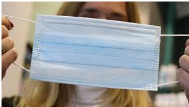
Maskenpflicht außerhalb des Unterrichts

Ergänzend zu den Erläuterungen des Hygieneplans Corona des Bildungsministeriums gelten für unser Schulzentrum ab Montag, 08.06.2020 die nachstehenden überarbeiteten Regeln: